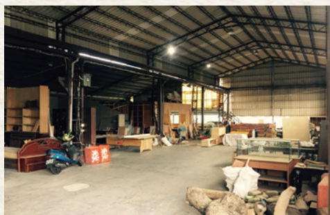
● 全仕風再生木工廠