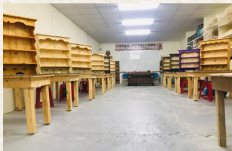
● 全仕風木工技訓中心